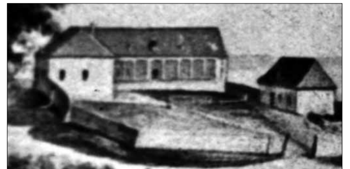
2. számú kép: Az épület és az istálló jelenleg ismert legkorábbi ábrázolása Petrich András 1814-ben készített rajzán

Az építési ügyekben járatos – több mint 40 tervet építtető, felújító – Esterházy Károly püspök figyelemmel kísérte a balatoni birtokán folyó munkálatokat, és „az épületekkel sietni nem jó” véleményé-