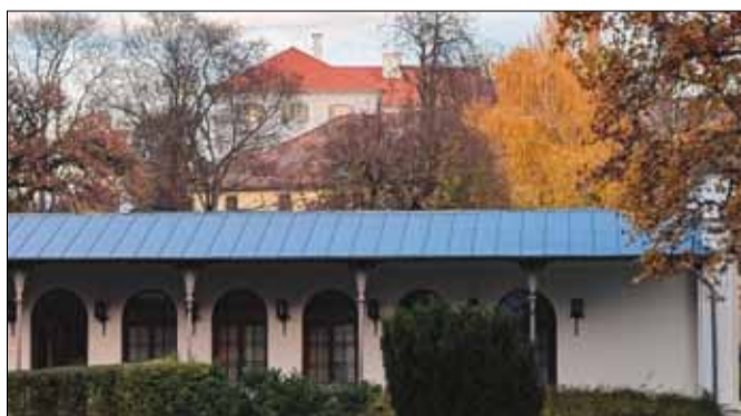
5. számú kép: ... és a régi, többször átépített épületek 2022 novemberében