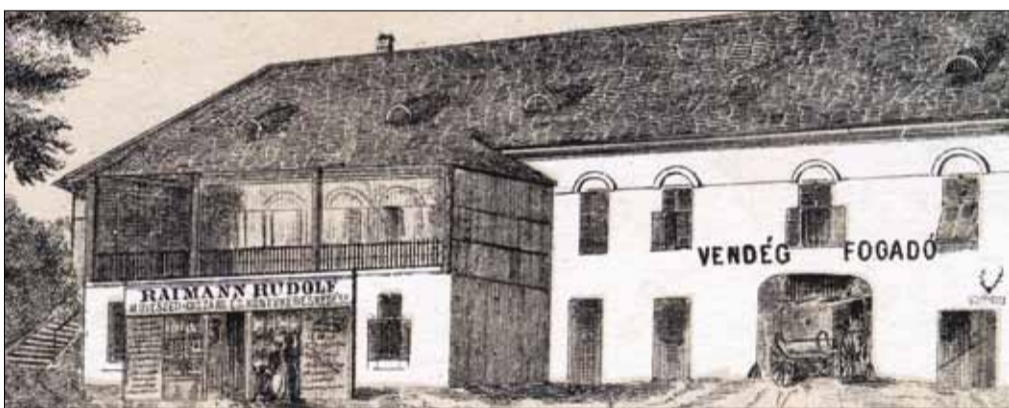
3. számú kép: Raimann Rudolf 1860 körül készített kőrajzán már a teraszos kávézóval bővített Glaser-féle emeletes vendéglő, földszintjén saját díszárú-és könyvkereskedése látható

Ugyanebben az esztendőben, 1827-ben tiltják el az „Esterházyn intselkedő” volt füredi fürdőorvost, a mindig új ötletekkel előálló Oesterreicher Manes Józsefet (1759–1831) egy ottani új savanyúvízkút ásásától. Az Esterházy-birtokon létesítendő ivókút és esetle-